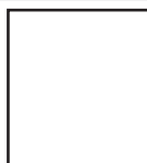
format w nekrologu wspomnieniowym